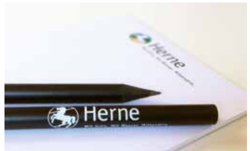
Block und Bleistift